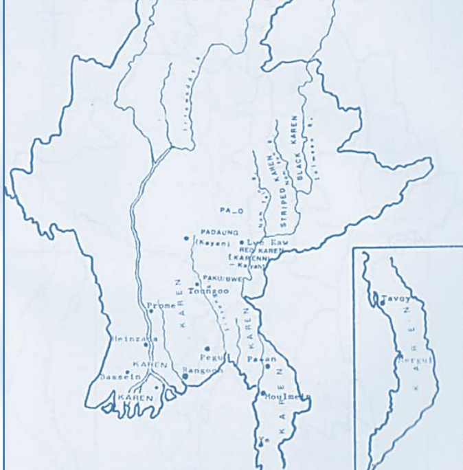
Karen Tribes in Burma and Their Settlements

ထိုနေ့ညနေအချိန်တွင် ကော်သူးလေအသံလွင့်ဌာနမှ ကော်သူးလေ ကရင်ပြည်ကို ထူထောင်ခြင်းနှင့် ကော်သူးလေအစိုးရကို ဖွဲ့စည်းလိုက်ကြောင်းကို ကမ္ဘာသို့ ကြေငြာ လေသည်။ အခြားတိုင်းနိုင်ငံများဖြစ်သော အိန္ဒိယ(All India Radio)၊ ပါကစ္စတန်(Radio Pakistan)၊ ဗြိတိန်(B.B.C)၊ အမေရိကန်(V.O.A) နှင့် ဩစတေးလျနိုင်ငံ အသံလွင့်ဌာန များလည်း ကော်သူးလေ အသံလွင့်ဌာနများမှ လွင့်လိုက် သော ကော်သူးလေကရင်ပြည် ထူထောင်ခြင်းနှင့် ကော်သူးလေအစိုးရအဖွဲ့ ထူထောင်ခြင်းများကို တစ်ဆင့်အသံလွင့် လေသည်။ ထို့ပြင် အခြားနိုင်ငံမှ သတင်းစာတချို့သည် စာလုံးကြီးများ နှင့် ထိုသတင်းများကို ရေးသာကြေငြာလေ သည်။